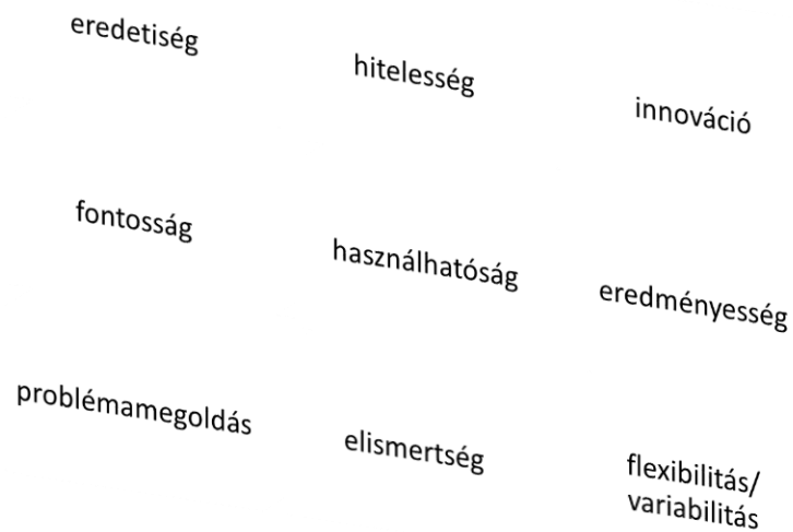
Ábra 3.3.3 Kritériumok a kreatív munka értékeléséhez